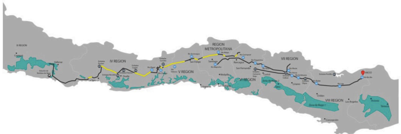
FIGURA 2: MAPA DETALLADO DE LOS DOS PRIMEROS TRAMOS DE LA CARRETERA HÍDRICA