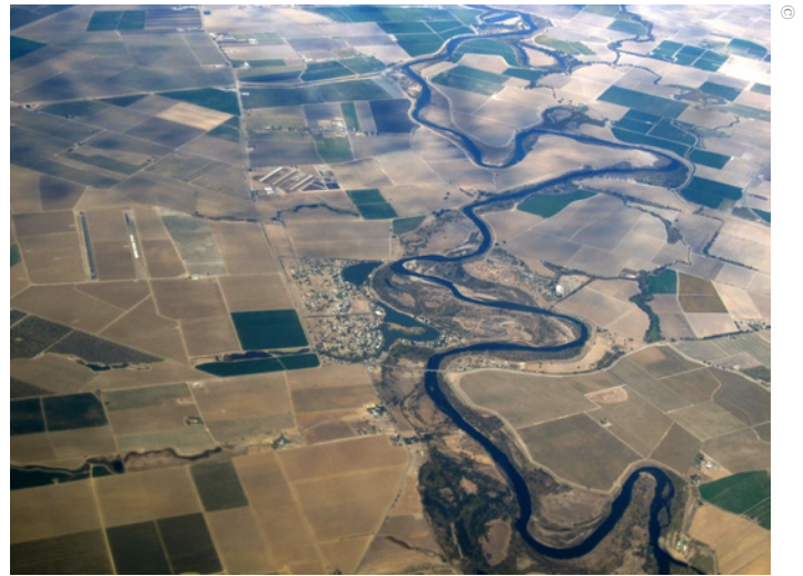
Una vista aérea del Valle de San Joaquín en California. El proyecto de riego allí es citado por Reguemos como un modelo, a pesar de afectar negativamente a los habitantes del valle.

Como evidencia a favor de su proyecto, Reguemos Chile destaca como ejemplo varios casos internacionales similares a la carretera hídrica que han sido “exitosos”. 45 Sin embargo, muchos de estos proyectos de infraestructura hídrica a gran escala han generado